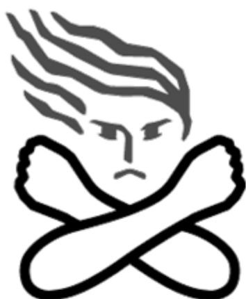
女性に対する暴力根絶のためのシンボルマーク

暴力は、親しい間柄であっても、どのような理由があっても、決して許されるものではありません。