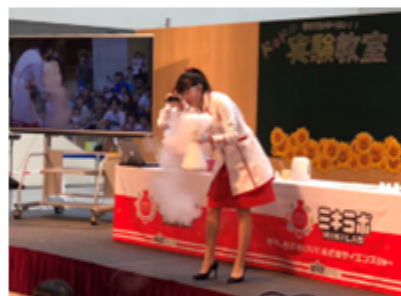
ときどき・わくわく サイエンスショーの様子