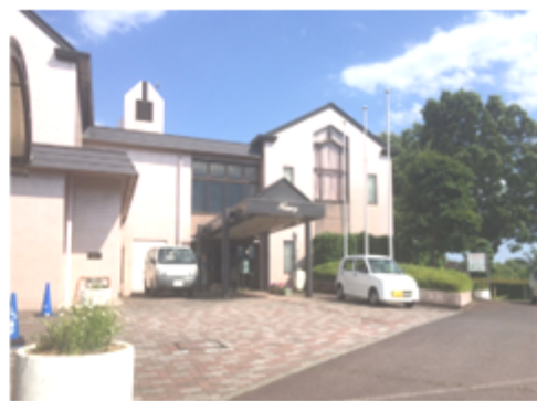
鶴ヶ島市女性センター「ハーモニー」