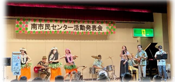
昨年開催した活動発表会のステージ発表