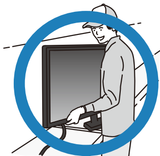
正しい処分方法で!

特定家庭用機器(テレビ、エアコン、冷蔵庫・冷凍庫、洗濯機・衣類乾燥機)については、ごみ集積所には出すことはできませんので、次の①②③のいずれかの方法で処分してください。 ①買ったお店または、買い替えるお店へ相談し、処分する。 ②自分で指定引き取り場所へ持ち込む。 ・郵便局で「家電リサイクル券」を購入する(廃棄物1台につき「家電リサイクル券」は1枚)。 ・指定引き取り場所(※1)に連絡し、搬入受付日時を確認し搬入する。 ③業者へ引き取りに来てもらう