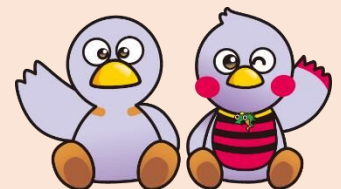
コバトン さいたまっち