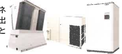
産業用・業務用ヒートポンプ例