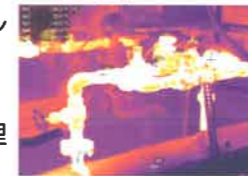
赤外線カメラ画像