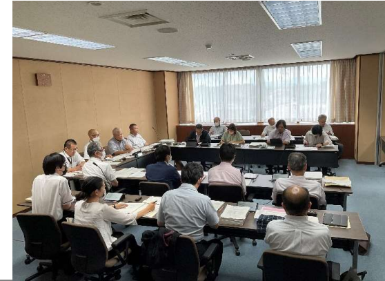
常任委員会・特別委員会・議会運営委員会