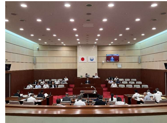
本会議・一般質問