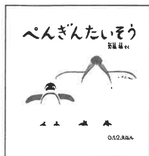
「ペンギンたいそう」