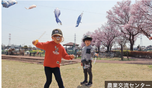
★ 農業交流センター