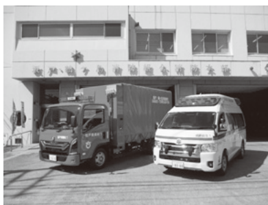
(左)資機材車 (右)高規格救急自動車

い、鶴ヶ島市消防団第三分団へ配備されました。この車両は鶴ヶ島市消防団では初めての総務省消防庁からの無償貸付車両であり、特徴は救助資機材搭載型で、チェーンソーおよび保護具一式が積載されており、多種多様化する災害への活躍が期待されます。今回の更新によって、市民の皆さんの安心・安全の確保に努めてまいります。