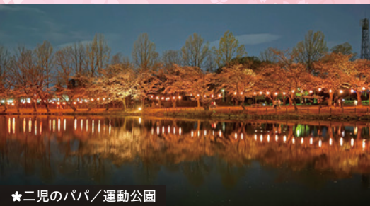
★ 二児のパパ / 運動公園