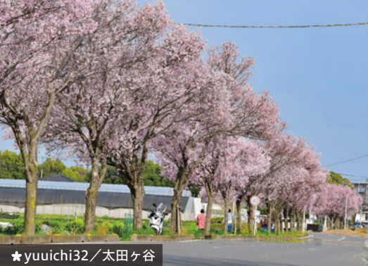
★ yuuichi32 / 太田ヶ谷