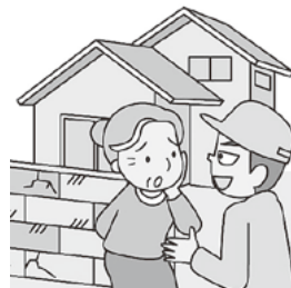
〈消費者庁イラスト集より〉

「近くで工事をしています。ご挨拶に伺いました」 「瓦が飛んで近所の人に迷惑がかかりますよ」 「今日、契約するなら特別に安くしますよ」