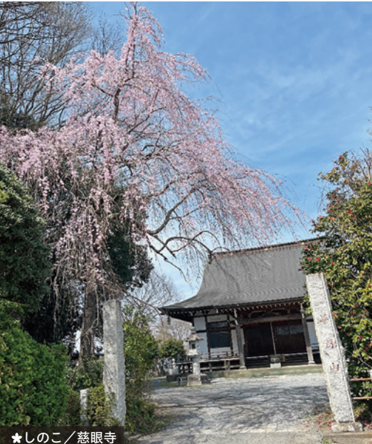
★ しのこ / 慈眼寺