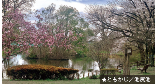
★ とまかじ / 池尻池