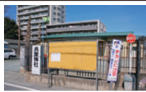
つるがしま中央交流センターの建設前