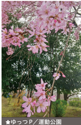
★ ゆっつP / 運動公園