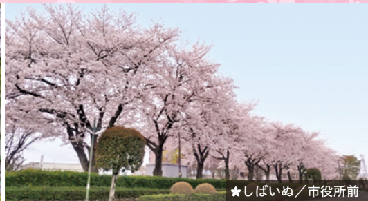
★ しばいぬ / 市役所前