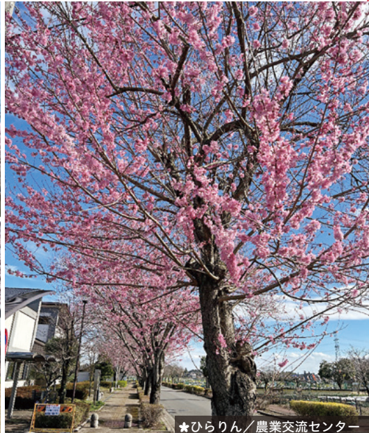
★ ひらりん / 農業交流センター