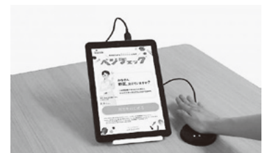
ベジチェックとは…センサーに手のひらを約30秒当てるだけで、野菜摂取充足度がわかる測定機器