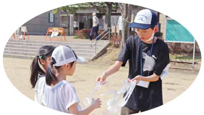
3月に行われた「おさんぽピクニック」の様子