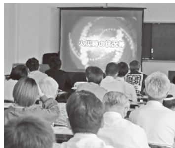
防火管理資格取得講習会の様子