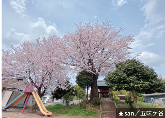
★ san / 五味ヶ谷