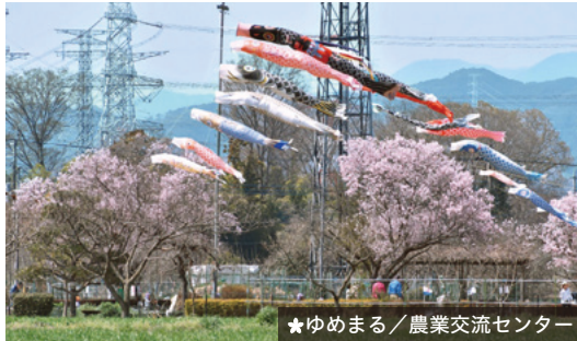
★ ゆめまる / 農業交流センター