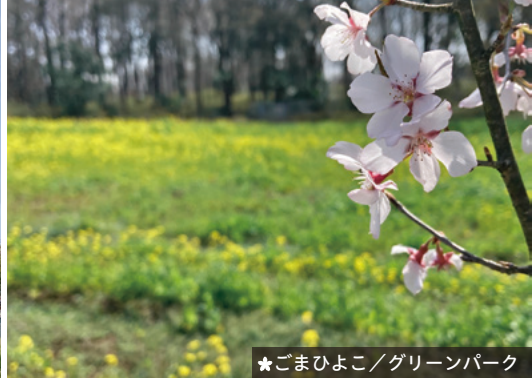
★ ごまひよこ / グリーンパーク