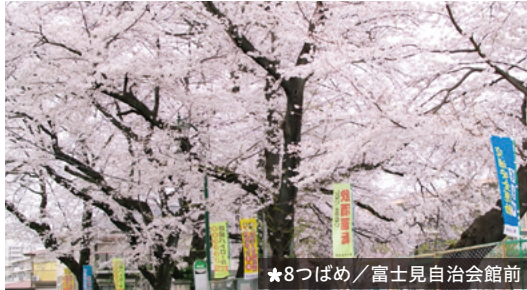
★ 8つばめ / 富士見自治会館前