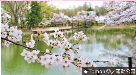
★ Tomon◎ / 運動公園