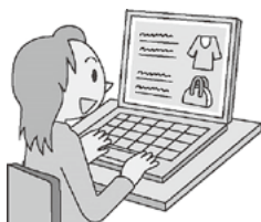
〈消費者庁イラスト集より〉

※ スクリーンショット(スクショ)とは、携帯電話やパソコンの「今表示されている画面」を画像として保存する機能です。商品注文後、画面表示が変更され、注文時と同じ画面が確認できなくなる可能性があります。注文時の画面を残しておくためにスクリーンショットすることが大切です