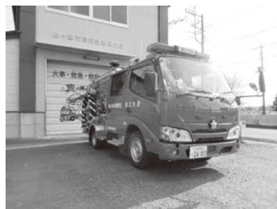
鶴ヶ島市消防団第三分団車両