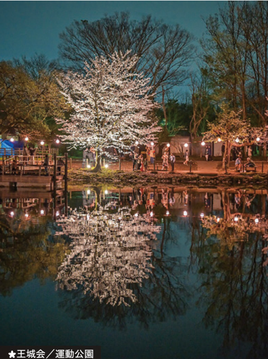
★ 王城会 / 運動公園