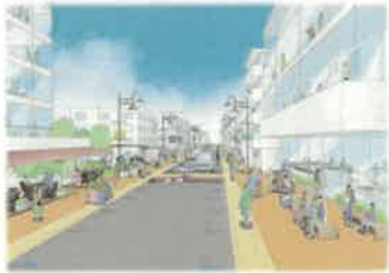
鶴ヶ島駅通りの 将来イメージ