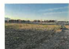
管理棟建設予定地