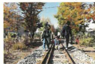
ガーデンツアー の様子

ガーデンパークオープン記念式典を開催します。併せて、ワークショップを開催し、活動団体設立を支援します。