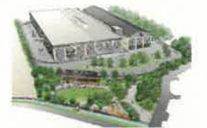
ガーデンパーク 完成イメージ

官民連携事業として整備されるガーデンパークのオープニングに併せて、関係団体や地域の方々の交流イベントを開催します