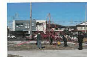
R5年12月に完成したわかばハンカチノキ公園

今年度(R5年度)のワークショップで寄せられた、市民の皆さんの声を反映した公園を整備します。 (一本松地区)