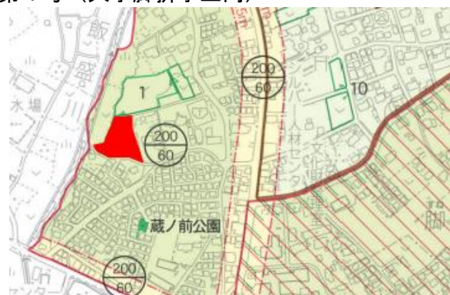
第1号（大字脚折字上向）