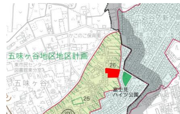
第26号（大字五味ヶ谷字子ノ神）