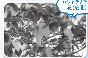
ハンカチノキの花(苞葉)

区画整理事業区域内に植える樹木のサンプルとして、旧若葉駅西口土地区画整理事務所跡地である現在の場所に植えられたのが始まりです。事務所解体工事の際に伐採される予定でしたが、市民の方から「珍しい木であるため残してほしい」との要望があり、残されることになり、公園のシンボルツリーとして親しまれています。