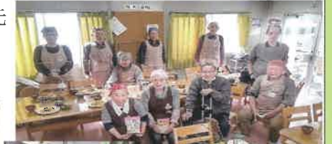
クラシックカフェも開催しました。