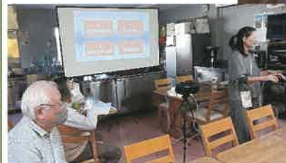
交流会館で第二木曜・第三金曜・第四木曜の月3回13時半から開催しています。新参加歓迎！