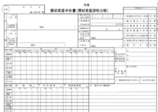
償却資産申告書の様式