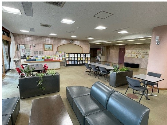
▲ちょっとした打合せや休憩にご利用ください

現在、談話コーナーでは飲食も可能です。どなたでも利用でき、予約も不要ですので、ぜひご利用ください。