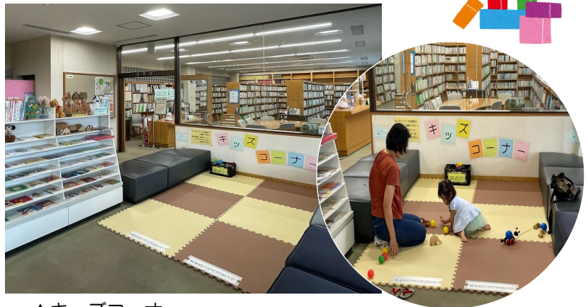
▲キッズコーナー 絵本やおもちゃもあります！！