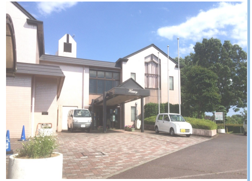
鶴ヶ島市女性センター「ハーモニー」

編集・発行 鶴ヶ島市女性センター 〒350-2213 鶴ヶ島市大字脚折1922-7 TEL:049-287-4755 FAX:049-271-5297 メール:10200020@city.tsurugashima.lg.jp