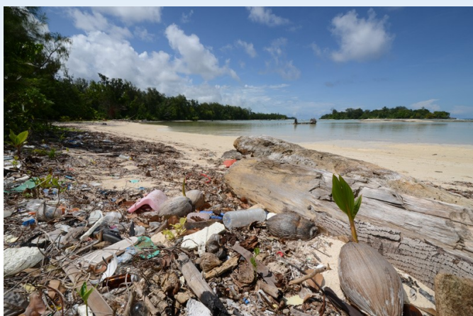
パラオ諸島ペリユー島に流れ着いたゴミ (2017年)