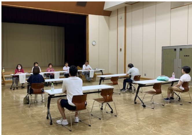
▲第1回目は、地域で活躍している5名にお話しいただきました！

今年度、全5回の開催を予定している富士見市民センター主催の講座です。この講座は、「地域について知ってもらい、自分は何がしたいのか、何ができるのかについて考える中で、自分の居場所を地域の中でみつけ、自分らしく生き生きと活躍してもらうこと」を目的として開催しています。対象は、20代～60代と幅広く募集中！次回は10月28日（土）を予定しています。参加申込み、お待ちしております。