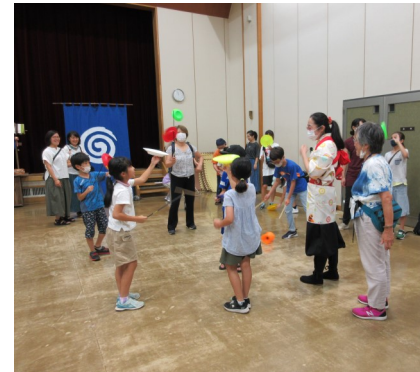
▲子どもも大人も一緒になって体験

8月4日、富士見地区地域支え合い協議会と共催で開催。講師の軽妙な語り口と、繰り出される凄技に、子ども達は声を上げ夢中になって見入っていました。昔あそびの体験や外国の伝承遊びまで、皆さん積極的に挑戦して楽しんでいました。