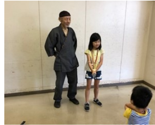
▲時代劇でおなじみ、タテの体験！

7月27日、時代劇に出演していた唐沢先生をお招きして、タテとお芝居の稽古をしました。タテの練習が始まると不安そうなお子もいましたが、カッコいい先生の立ち居振る舞いを見て勇気を出して挑戦することができました。お芝居では子と母の別れのシーンの情景を上手に演技することができました。