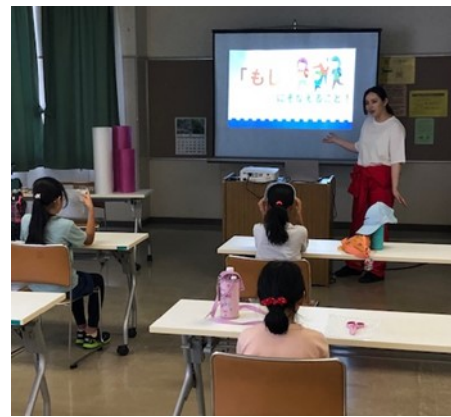
▲プチプチが防災を考えるきっかけに

7月28日、荷物の梱包材（プチプチ）の製造、販売を手掛ける川上産業株式会社様をお招きして、子どもたちと防災や環境について学びました。その後の制作ではプチプチを材料に、避難所で使用できるポンチョ（防寒着）を作成しました。低い確率で丸い形のプチプチの中にもハート型のプチプチがあるとのこと。必死に探して発見している子もいました。防災が楽しく、より身近に感じる機会になったのではないかと思います。