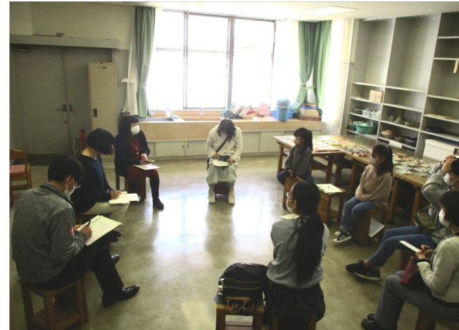
▲感じ方を整理すると、本がよりおもしろくなる！

富士見市民センターでは、ロビーにある本棚（どこでもまちライブラリー）を多くの方に知ってもらい、より充実させるためイベントを開催しています。今回は本の読み方や、感じ方を参加者同士が話すことで、夏休みの読書感想文のヒントにしてもらおうと企画しました。感想を書いたふせんを項目ごとに分類するテクニックなど、日常の読書でも参考になりそうな読み方を知る機会になりました。