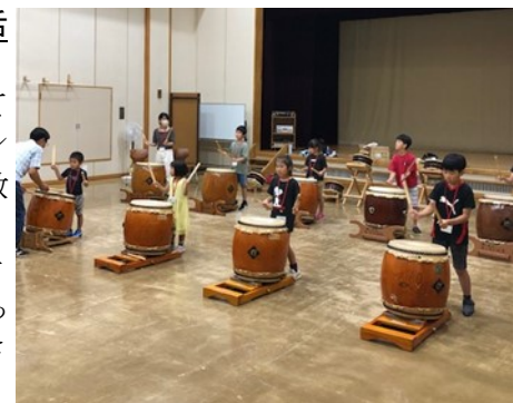
▲富士見市民センターでの練習風景

7月22日、富士見市民センターで活動している「富士見太鼓連」の方に、「月夜のポンチャラリン」と「鶴ヶ島ふるさと音頭」を教わりました。8月5日の富士見連合自治会納涼祭では堂々と演奏することができました。4年ぶり待ちに待った納涼祭の夜、力強い太鼓の音が響きわたりました。