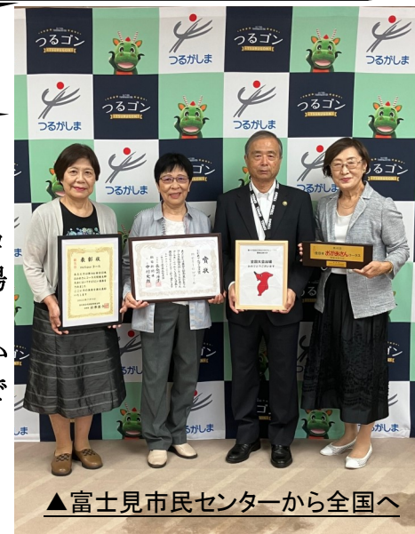
▲富士見市民センターから全国へ

富士見市民センターで活動するコーラスサークル「mellow(メロウ)コール」が兵庫県で開催されたおかあさんコーラス全国大会に出場し、“おかあさんコーラス賞”を受賞しました。また、9月4日には鶴ヶ島市長に大会結果の報告を行いました。富士見から全国に名を轟(とどろ)かせたmellowコールさん、本当におめでとうございます👏