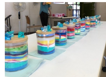
▲涼しげなビン飾り。真剣に制作していました

7月28日、小ビンにカラフルなお塩を重ね飾り付けをするグラスソルトアートを制作。何層にも重なる塩のデザインは独特で、子どもたちも興味しんしん。思い思いの色を重ね真剣に取り組んでいました。完成品を並べると、まるで南国の砂浜のよう。カラフルで夏らしい作品ができあがりました。