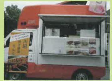
だんごのキッチンカー出店