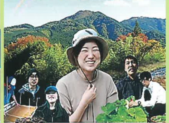
東秩父村 東秩父村ドキュメンタリー制作委員会