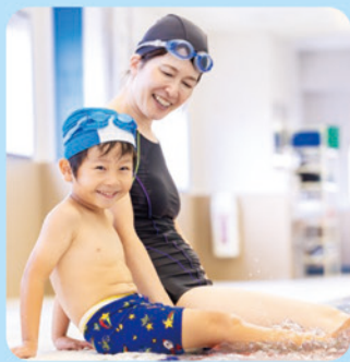
キッズ(親子)クラス