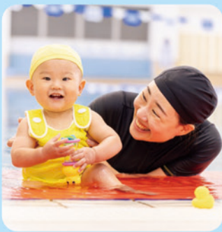
ベビー(親子)クラス