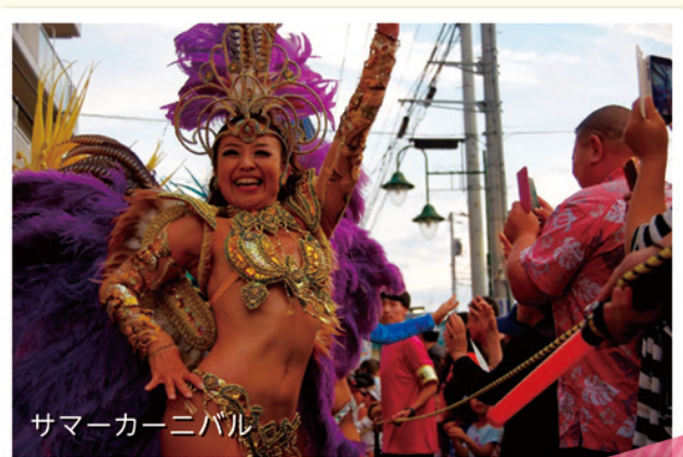
サマーカーニバル