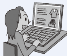
※ イラストは「消費者庁イラスト集より」

※ 送信したメールの保存やウェブサイト上のクーリング・オフ専用フォームの画面はスクリーンショットし、送信記録を残すようにしましょう