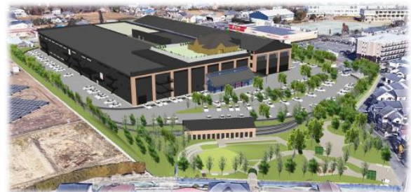
「(仮称) Nゲージとガーデンパーク」のイメージパース