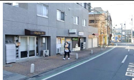
沿道宅地のセットバック空間の例

※セットバック空間とは、道路境界線から建物を離して（後退して）建てることにより、道路と建物間に生じる空間（宅地）で、一般に開放された場（歩行路・広場等）として使用する空間をいう。