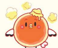
イラスト フルタ ハナコ