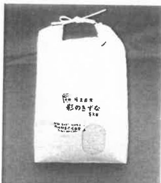
4等③ 店頭精米した埼玉県産米 「彩のきずな」（鈴木米穀店）