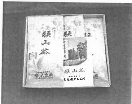
4等① S-GAP実践農場の茶専業 農家製造の狭山茶（大宝園）