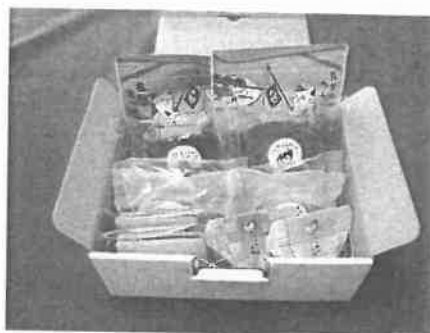
4等④ 茶農家こだわりのほうじ茶・ 抹茶スイーツセット（長峰園）