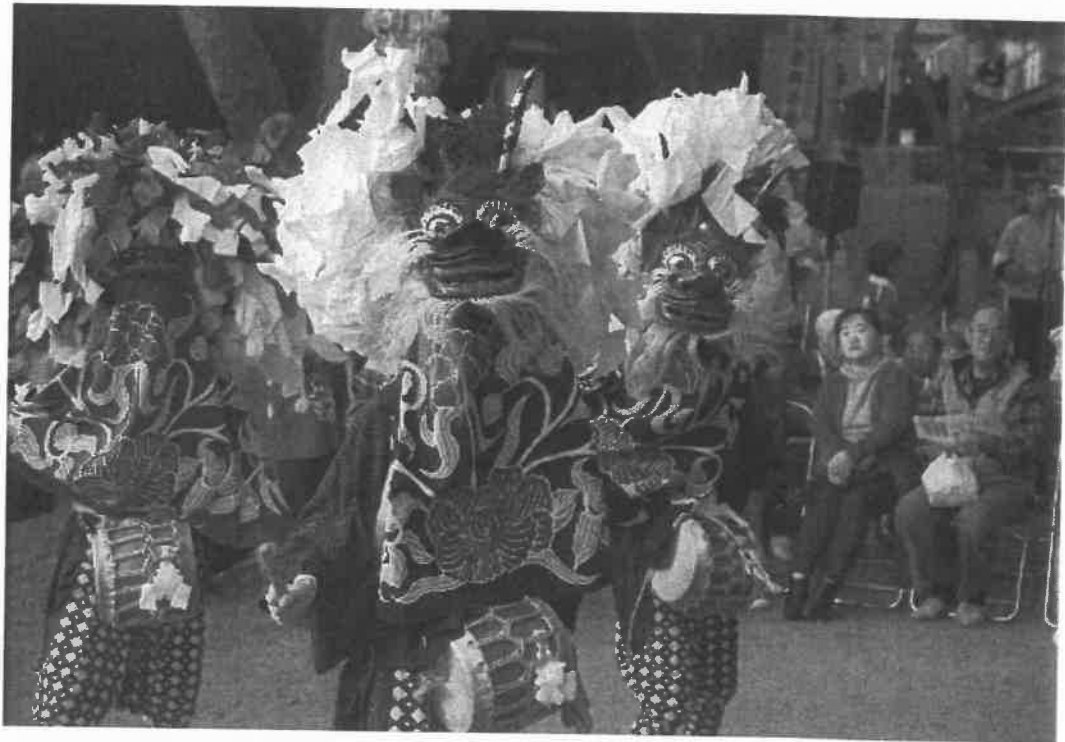
水引きを付けて舞う獅子舞