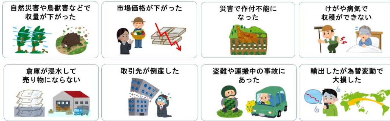
<収入保険の補てん方式>