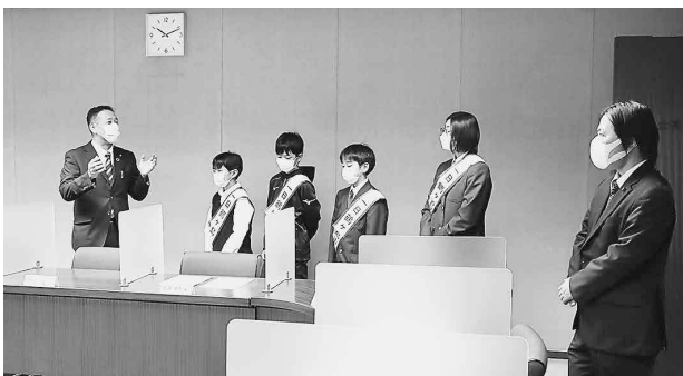
受賞者に全員協議会室を御案内