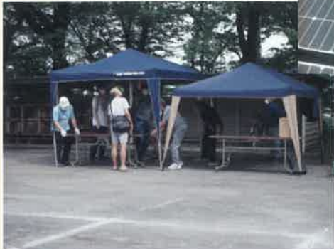
健康状態が心配の方はテントにて回復待ち