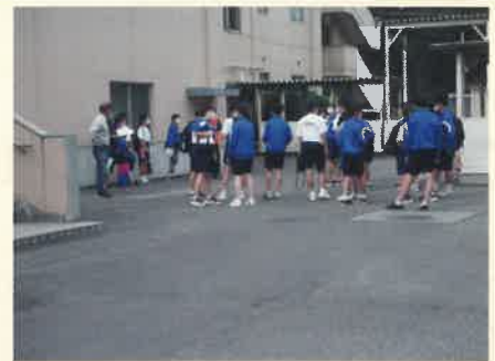
頑張る中学生ボランティア