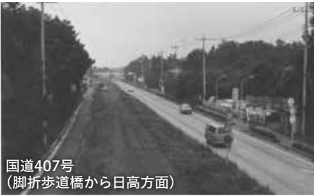
国道407号 (脚折歩道橋から日高方面)