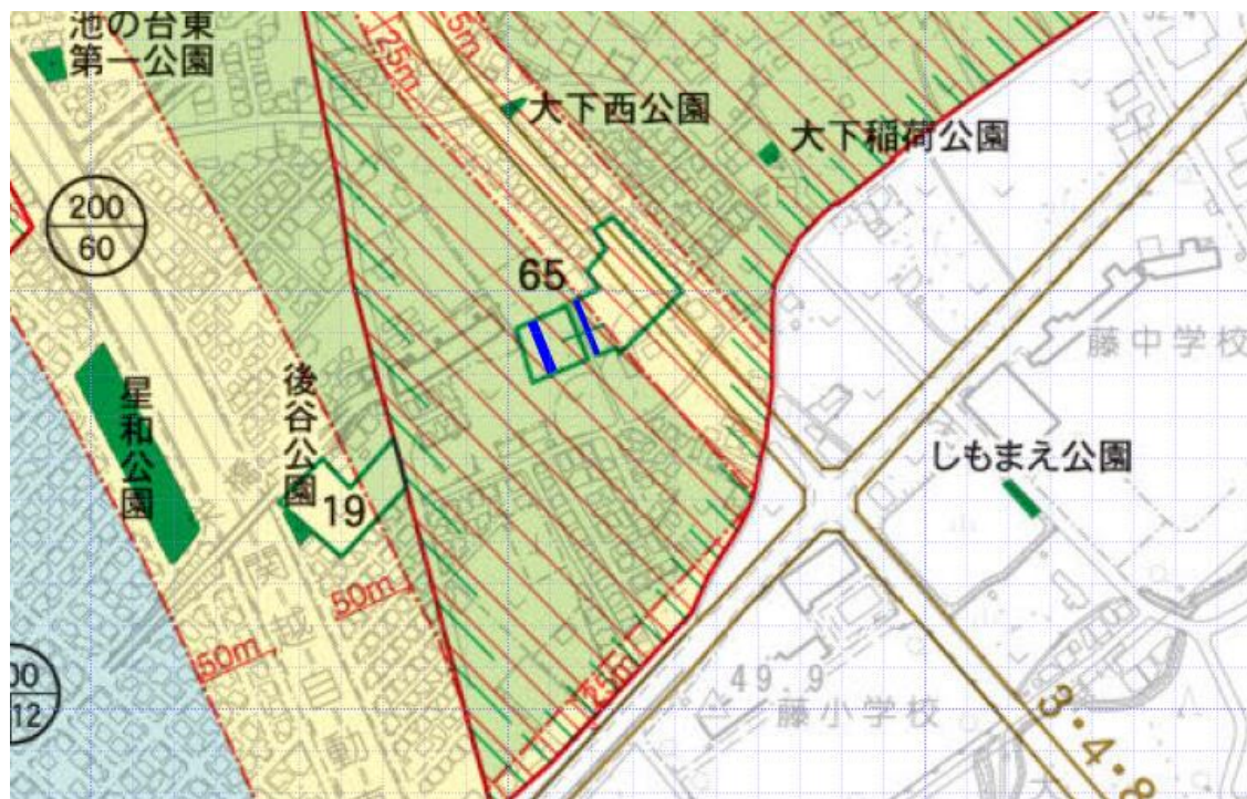
青：開発行為に伴う道路が設置された生産緑地