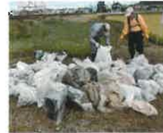
・飯盛川、大谷川清掃