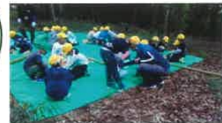
・生態系の野外学習会