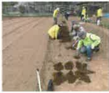
・鶴ヶ島千本桜構想