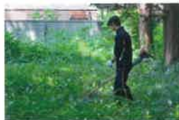
・社協主催ボランティア体験会開催

活動目的 鶴ヶ島市内及び近隣地域に残された里山の保全・回復活動を通して、会員相互の親睦と良好な里山を次世代に継承することにより、市民だれもが健康かつ安心して生活を継続できるまちづくりを推進していくことを目的としている。