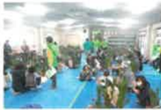
・坂戸市での門松教室