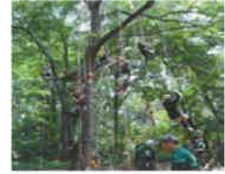
・プレーパーク ・タケノコ掘り ・流しソーメン