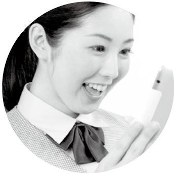
24時間いつでもどこでも

10月1日(木)から、図書館で電子書籍貸出サービスを開始します。 約600タイトルの資料を、パソコンやスマートフォンなどで読むことができます。 ※ 資料は、今後増やしていく予定です