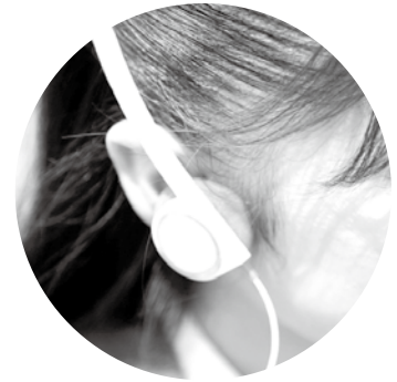
文字の大小や読み上げも (一部コンテンツ)

利用できる方 鶴ヶ島在住・在勤・在学の方で、利用カードをお持ちの方 (カードをお持ちでない方は、カード申請をしてください)