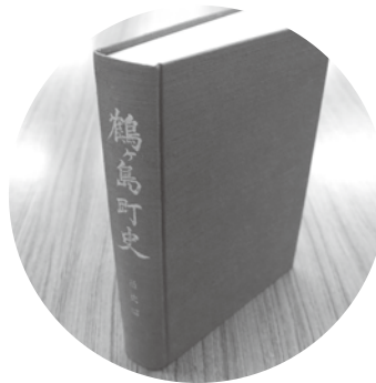
鶴ヶ島町史 (通史編)