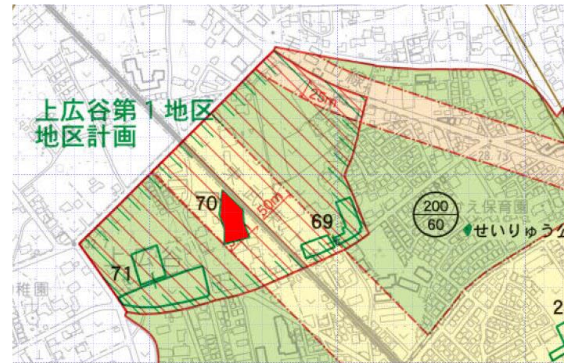
赤：行為制限が解除される生産緑地（見込み）