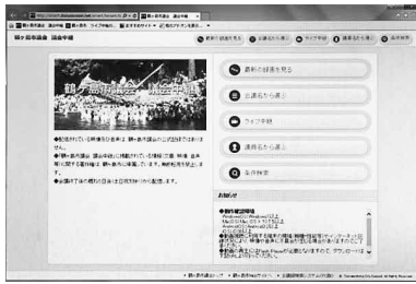
議会インターネット配信の画面

なお、会議録の作成は、議会閉会后2か月程度かかります。第4回定例会（12月議会）の会議録は、3月初め頃から御覧になれます。