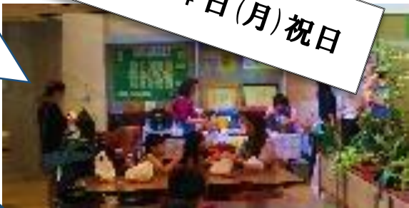
ロビーで、飲み物や食べ物を販売しました。