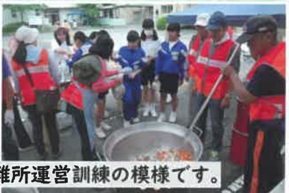
写真は、昨年の6月の避難所運営訓練の様様です。