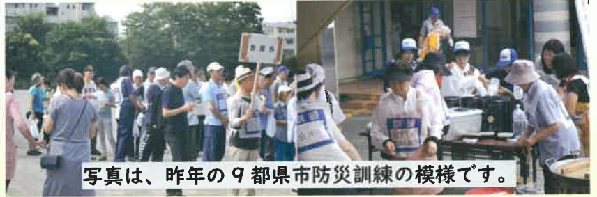
写真は、昨年の9都県市防災訓練の様様です。

一言で防災といっても、とてもいろんなケースがあって、防災については全てを自分1人で何とかできるというものではないので、どこまで手を付けていいのかが非常に皆さん悩まれているのではないかと考えています。そこで地域の力が重要です。