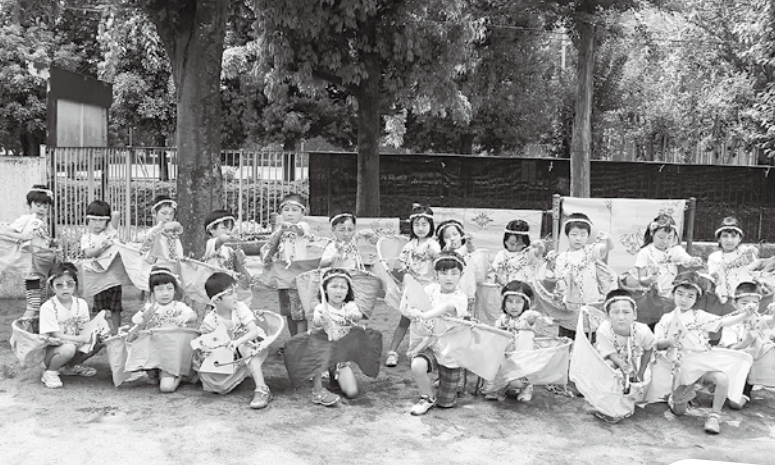
川鶴保育園の おともだち♪ 保育園祭りの練習中!