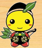
毛呂山町: もろ丸くん