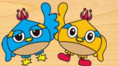
日高市: くりっかー & くりっぴー