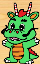
鶴ヶ島市: つるゴン