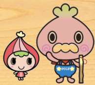
川島町: かわべえ & かわみん