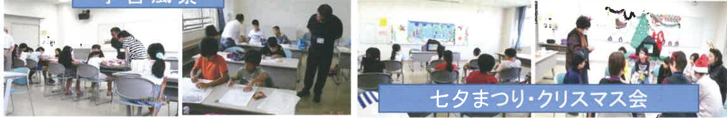
七夕まつり・クリスマス会

2019年 総会のお知らせ 期日 4月28日(日) 10時から 場所 鶴ヶ島市西市民センター