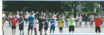
若いも若きも みんなで一緒に踊り ました