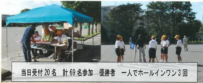
当日受付 20名 計 69名参加 優勝者 一人でホールインワン3回