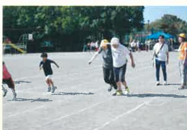
何故か 60m 走で二人三脚?