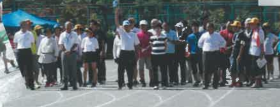
早飲み競争の出番を待つご来賓