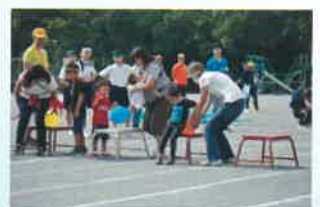
写真は昨年の様子です。

第7回サザンふれあい運動会を開催いたします。支え合い協議会のきっかけになった運動会です。13自治会が一つになり素晴らしい一日にしたいと思っています。奮って参加してください。