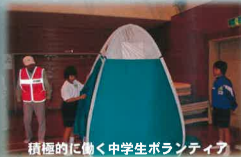
積極的に働く中学生ボランティア