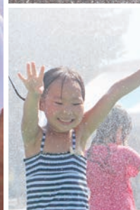
8月26日に開催した「つるがしま水かけまつり」。鶴ヶ島が誇る伝統行事「脚折雨乞」と、市が東京オリンピック・パラリンピックでホストタウンとなっているミャンマーの国民的水かけ行事「ダジャン」を融合した初めての試み。様々な人が集まり、水をかけあいながら交流を深めることができた、大盛り上りのイベントになりました。