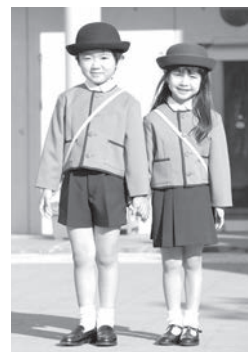
市内幼稚園一覧表

補助金 保護者の所得に応じて就園奨励費(年額0円〜30万8000円(平成30年度補助額)を交付しています。 ※詳しくは、各幼稚園にお問い合わせください。