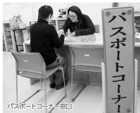
パスポートコーナー窓口

祝日(日曜日を除く)、年末年始を除く) ※申請と交付の業務日・時間が異なりますのでご注意ください。