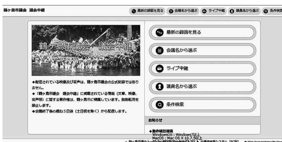
議会インターネット配信の画面