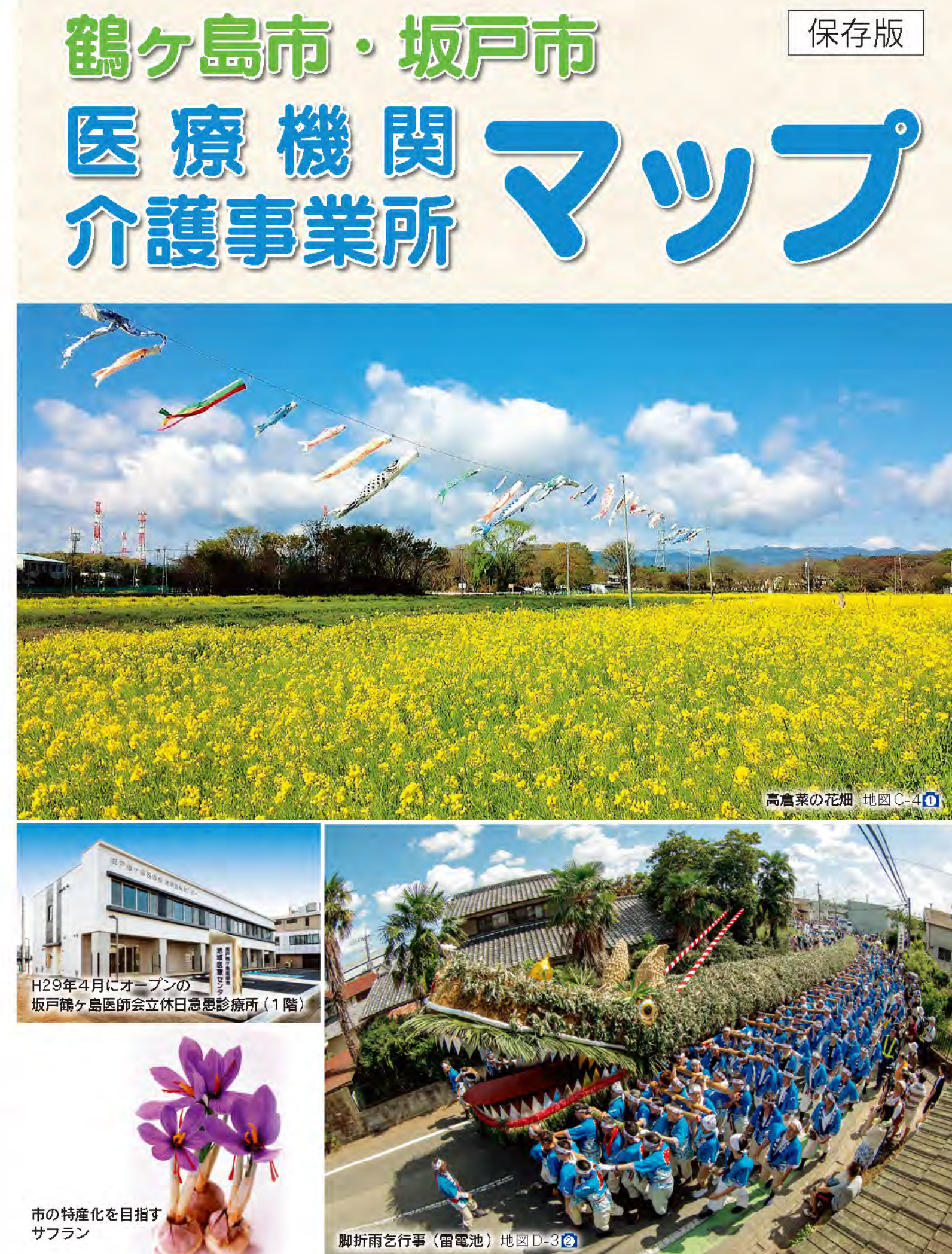
市の特産化を目指す サフラン 鶴ヶ島市