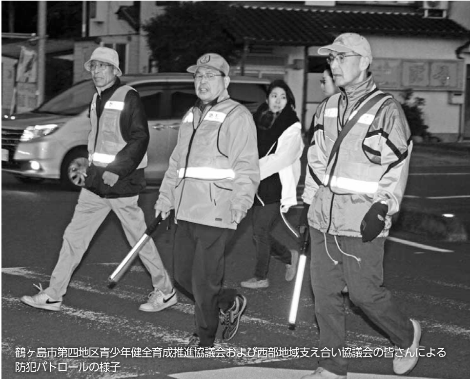
鶴ヶ島市第四地区青少年健全育成推進協議会および西部地域支え合い協議会の皆さんによる防犯パトロールの様子