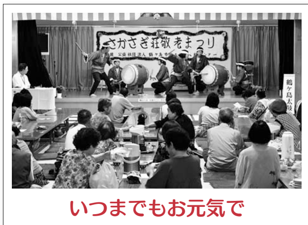
いつまでもお元気で

9月12日、南市民センターで行われた子育てサロン「ファミリーコンサート～赤ちゃんと一緒に音楽を」。バイオリンなどの楽器に子どもたちは興味深々。みんなの好きな曲が演奏されると親子で一緒に口ずさみ優雅なひとときを過ごしました。