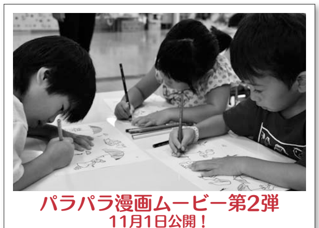
パラパラ漫画ムービー第2弾 11月1日公開！

9月18日、老人福祉センター逆木荘で「第1回逆木荘敬老まつり」が行われました。当日のステージでは、詩吟や手品、沖縄踊りなどが披露されたほか、懐かしのメロディーと一緒に歌うコーナーもあり、参加者は時を忘れて楽しんでいました。