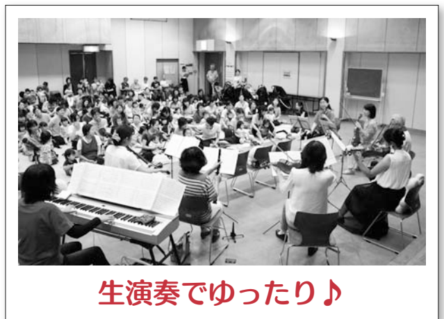
生演奏でゆったり♪

8月31日、女性センターでボランティア養成講座オープニング講座が開催されました。「1%の努力と99%の思いやり」と題して在宅医療についてお話していただきました。