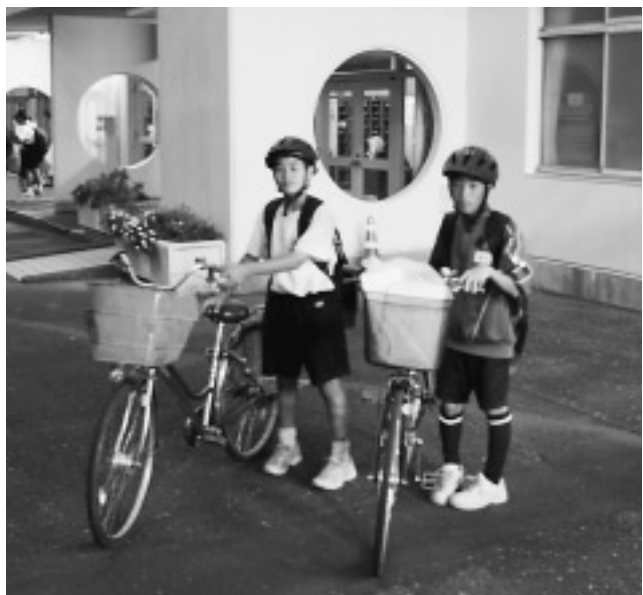
ヘルメットをして自転車で下校する生徒