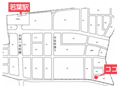
保留地公売地(若葉駅西口地区)