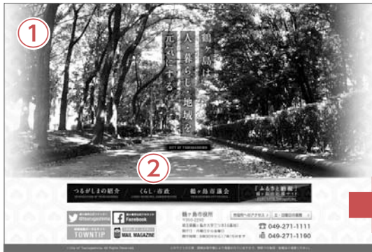
総合トップページのメニュー「くらし・市政」をクリックすると、右のページが開きます。

平成26年12月19日に鶴ヶ島市ホームページを全面リニューアルしました。少ない操作で必要な情報が得られるように、デザインや検索機能などを大幅に見直しています。今号ではそのポイントをお知らせします。 問合せ先 市政情報課広報広聴担当